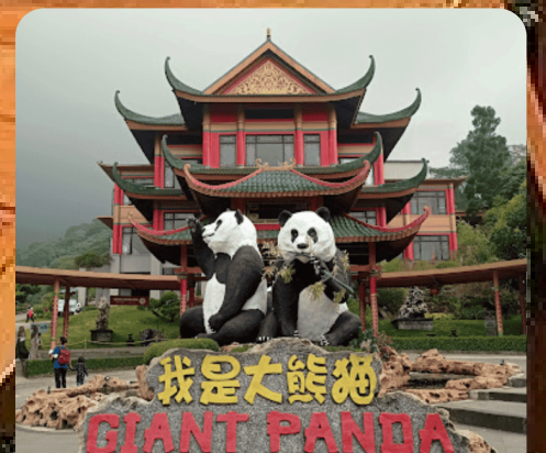
Istana Panda Taman Safari