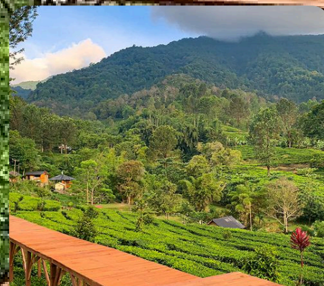
Agrowisata Gunung Mas