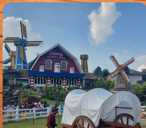
Cimory Dairyland Riverside