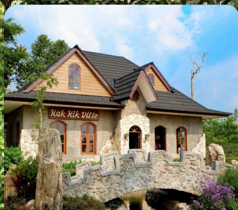
The Ranch Cisarua Puncak